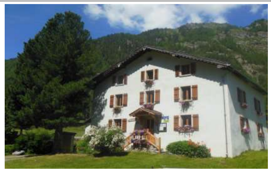
Chalet Maison de Pays, 357m 2 , composé de 2 logements indépendants, 8 chambres au total

Opportunité à ne pas manquer : possibilité de transfert d'un permis de construire obtenu en 2013 permettant d'agrandir le bâtiment